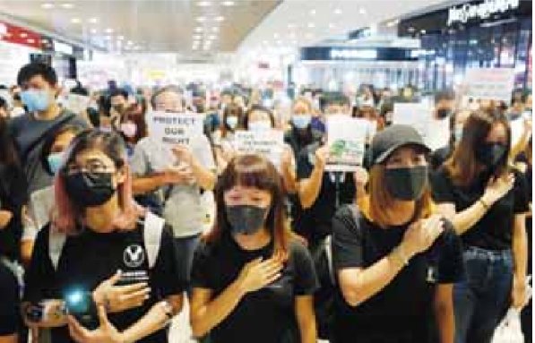
Anti-government protesters sing Glory to Hong Kong during a sit-in at Yoho Mall in Hong Kong.

A Hong Kong court rejected a government-requested ban on broadcasting or distributing the protest song "Glory to Hong Kong" in a landmark decision that rejected a challenge to freedom of expression in the city. The song was written during mass protests against the government in the Chinese territory in 2019 and its lyrics call for democracy and liberty. The song has since been mistakenly played at several international sporting events instead of China's national anthem, "March of the Volunteers." Judge Anthony Chan on Friday refused to grant the ban, which would have targeted anyone who uses the song to advocate for the separation of