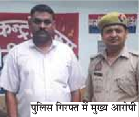
पुलिस गिरफ्त में मुख्य आरोपी

धर्मांतरण के मामले में मुख्य आरोपी की गिरफ्तारी होने के बाद खुफिया विभाग की टीम ने क्षेत्र में डेरा डाल दिया है। खुफिया विभाग अब यह पता लगाने में जुटा है कि गांव शाहजहांपुर के अलावा और किन गांवों में धर्मांतरण किया गया है। गांव शाहजहांपुर में एक सप्ताह पूर्व धर्मांतरण कराने का आरोप लगाकर हिंदू युवा वाहिनी के कार्यकर्ताओं ने जमकर हंगामा किया