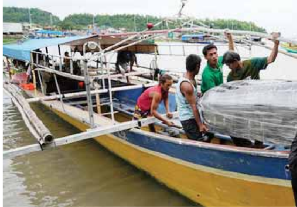
A coffin of one of the victims of a passenger ferry that capsized is carried on a boat at a port in Binangonan, Rizal province, Philippines on Friday.

The skipper of a Philippine ferry which flipped over in a lake in an accident that killed 27 passengers decided to sail despite knowing that his boat was filled beyond capacity, the coast guard chief said Friday. Forty-three passengers were rescued after the M/B Aya Express capsized in Laguna de Bay on Thursday shortly after leaving Binangonan town southeast of Manila in what should have been a 30-minute cruise to nearby Talmim Island, officials said. Coast guard, police and other government personnel continued to search the lake Friday but said they had no idea whether anyone was still missing because of uncertainties over the number of passengers on the ferry. No more survivors or bodies were found.